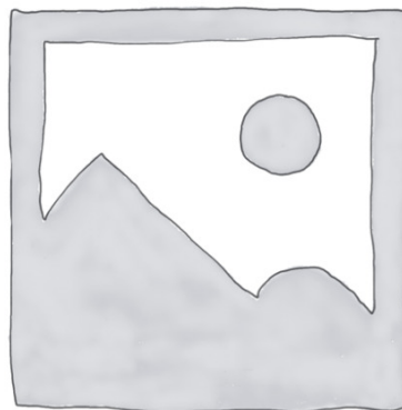
Maßzeichnung folgt in Kürze

Bitte beachten: Dieser Kühltisch zum Anschluss an die Zentralkälte ist nur auf Bestellung erhältlich. Bitte berücksichtigen Sie die dadurch bedingten längeren Lieferzeiten.